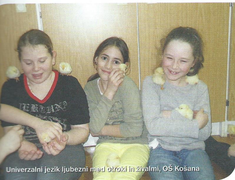
Univerzalni jezik ljubezni med otroki in živalmi, OŠ Košana

V naslednji številki: Spremeni svoj obrok in spremenil boš okolje.