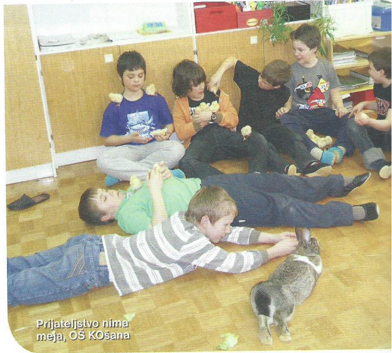
Prijateljstvo nima meja, OŠ KOšana